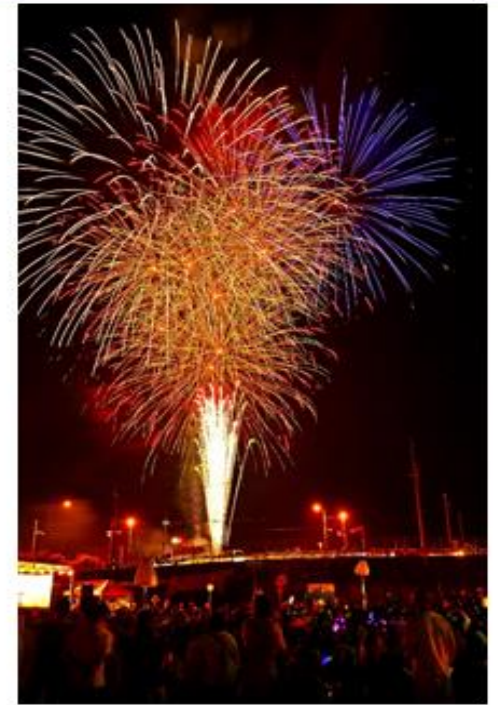
大賞 *撮影者敬称略 題名 夏祭り 撮影者 法代地 昭年