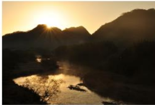
銅賞 題名 ダイヤモンド高山