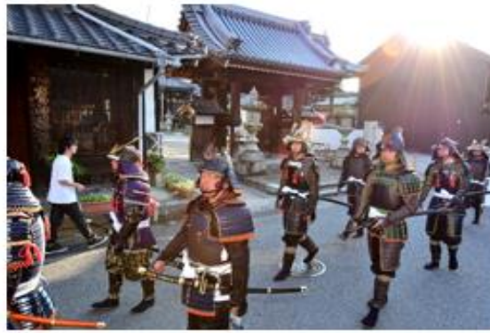
銀賞 題名 武者行列