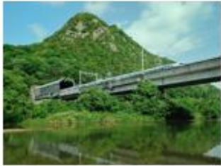
題名 新緑の新高山城跡