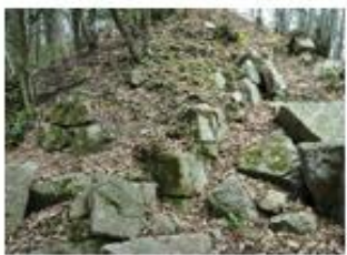
題名 廃城・壊された石垣