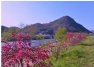
題名 春爛漫