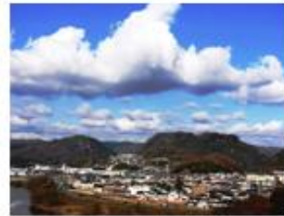
題名 初冬風情