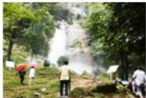
小雨の日 (瀧雪の滝)