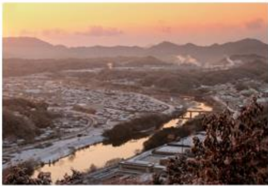
銅賞 題名 雪の朝