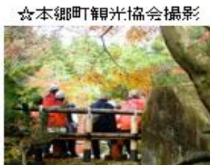
錦秋に憩う (三景園)