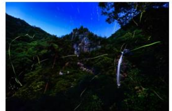
金賞 題名 瀑雪の滝に虫舞う