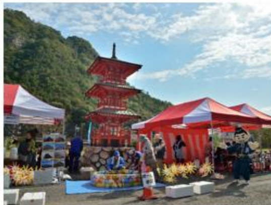
銅賞 題名 高山と名水祭