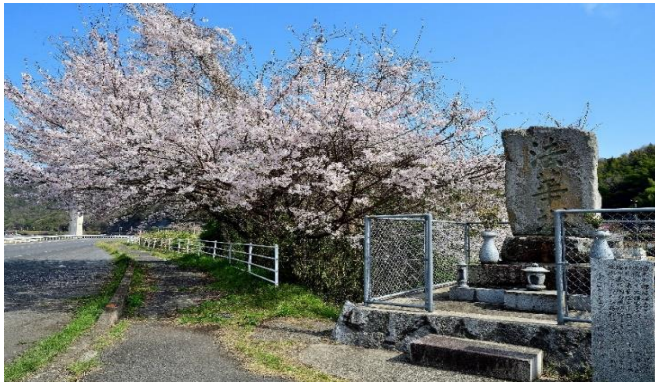
銅賞 題名 法華塔と桜 小林 誠三