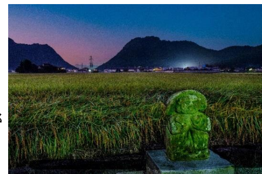
題名 沼田の荘 田の神 竹原準一郎