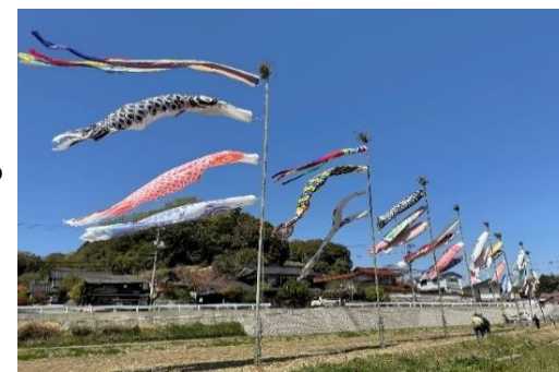
題名 気分爽快! 小舟木村の 鯉のぼり 森川実夫