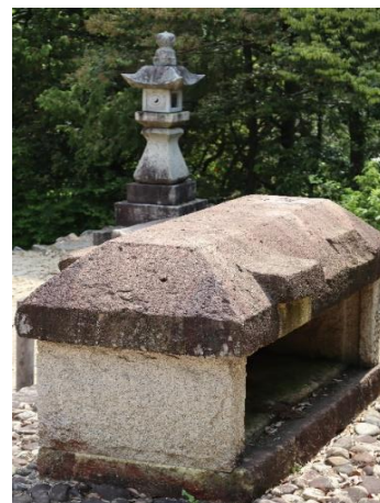
題名 古の豪族 中本満康