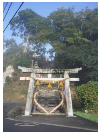
題名 良縁魔除けハートの茅の輪舟海.参り 坂田武志