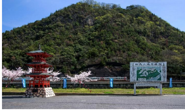
金賞 題名 銘水の郷 清政 健一