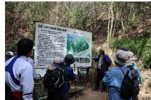
題名 勉強になります 熊野和久