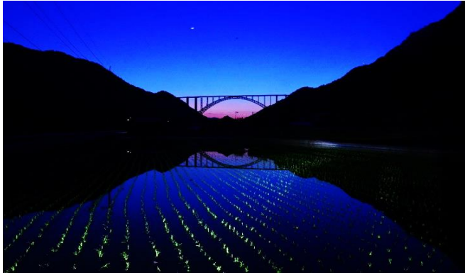
銅賞 題名 広島空港大橋の夕暮れ 新田 滋郎